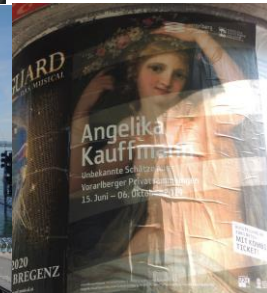
Kunsthhaus & Museum Vorarlberg